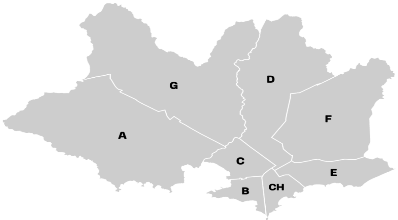
Imagen 1: Mapa de los municipios de Montevideo:

Imagen 1, mapa de los municipios. Basado en la Intendencia Municipal de Montevideo. (s.f.).