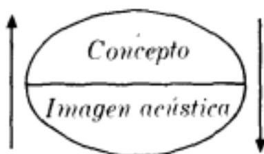
Figura Nro. 2.

Lacan se servirá de algunos aportes de Saussure (1945/1961) en cuanto al signo. Para Saussure (1945/1961) el signo lingüístico une una imagen acústica y un concepto. Esta imagen acústica y este concepto poseen una correspondencia biunívoca, esto quiere decir que a ese concepto le corresponde solo esa imagen acústica, y viceversa, en este sentido, “estos dos elementos están íntimamente unidos y se reclaman recíprocamente” (Saussure, 1945/1961, p. 92). Como lo vemos en el siguiente esquema: