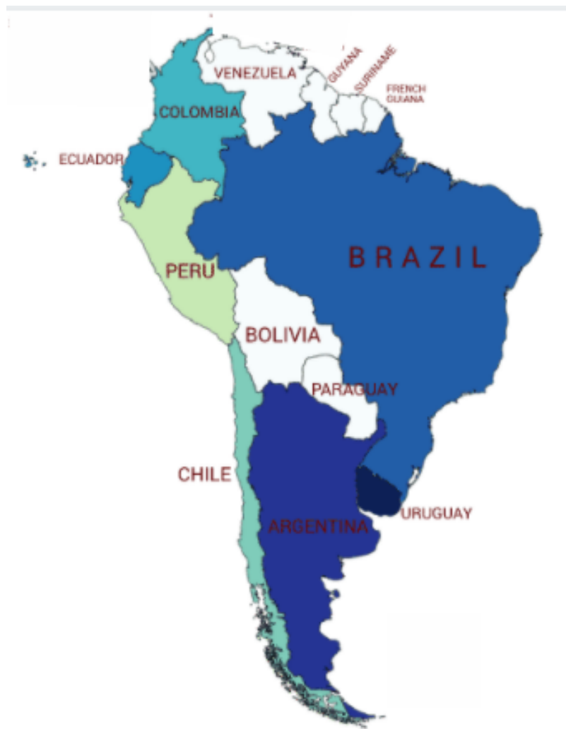
Figura 2. Mapa América Latina. Elaboración propia a partir de la Figura 1. El color azul más oscuro representa una mayor inclusión de población LGTB+.

Como se observa en el mapa de la ILGA (donde se superpusieron los resultados de HCSS) los países que figuran en la escala de rojo representan los países con mayor índice de Homofobia de Estado y los países en escala de azul representan los países con menor índice de Homofobia de Estado. En el estudio de HCSS, los países con mayor puntaje, poseen un índice de inclusión de población LGTB+ menor en sus Fuerzas Armadas.