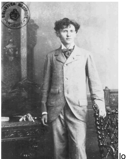
Retrato de Roberto de las Carreras

Nota. Tomado de peatonaltours (s.f.). Instagram