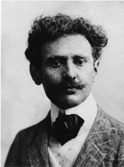
Retrato de Roberto de las Carreras